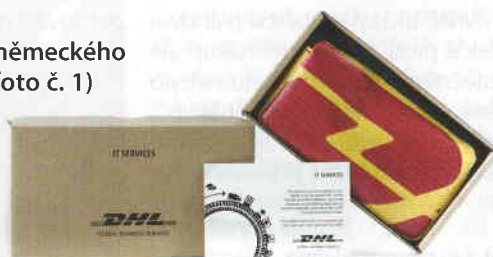
foto č. 3